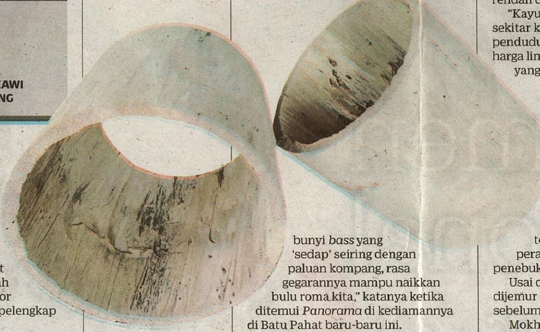
KAYU pokok durian digunakan dalam pembuatan jidor kerana tahan lasak.

"Jidor ibarat dram dalam muzik moden sekarang ini. Ia menghasilkan