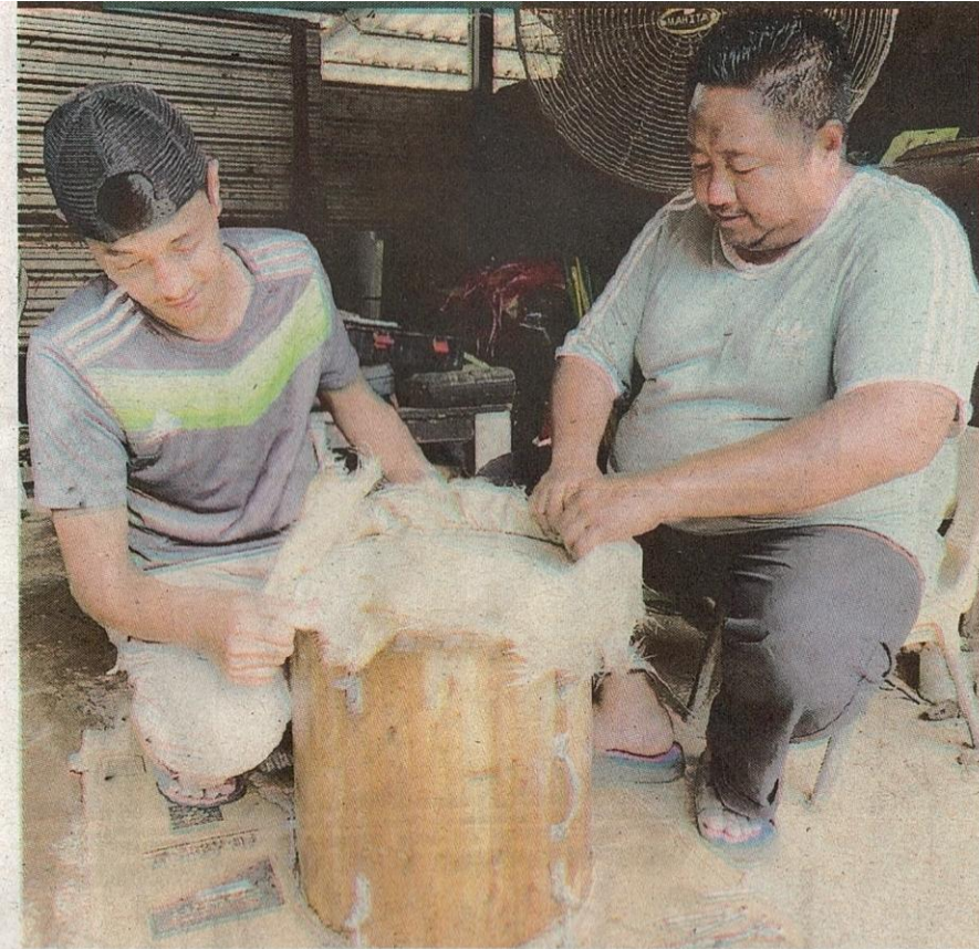
PEMASANGAN kulit kambing pada badan atau rangka daripada kayu pokok durian dilakukan dengan kemas bagi pembuatan jidor.